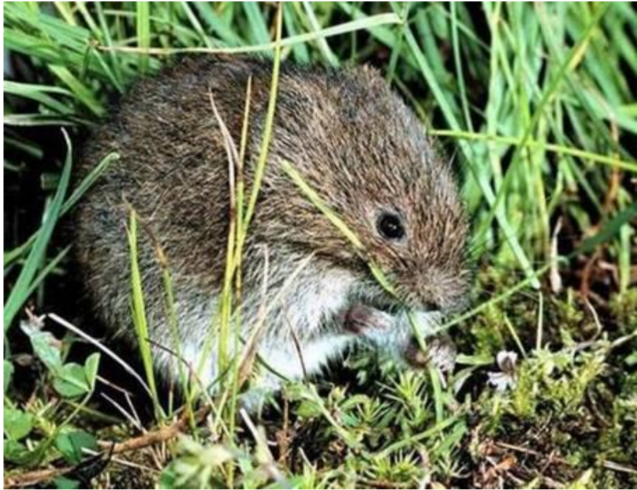
Полевка-экономка - Microtus oeconomus (Pallas

http://www.apus.ru/site.xp/049051056048124053054050052.html