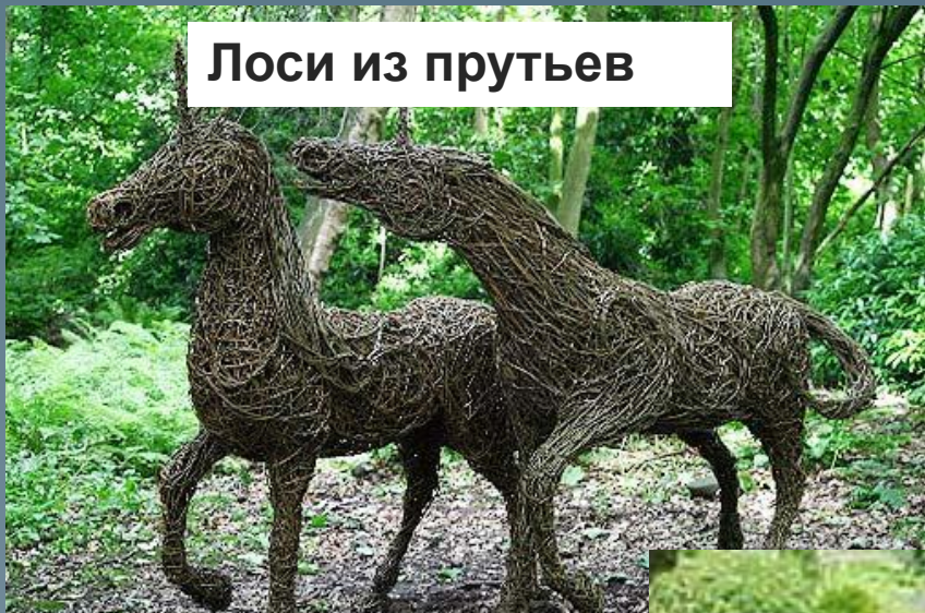
Лоси из прутьев

Участок можно облагородить фигурами из проволоки и плюща, а также из прутьев.