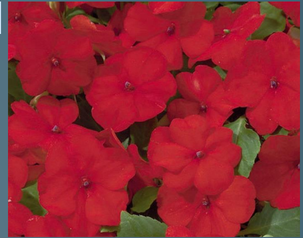
Бальзамин Уоллера ред