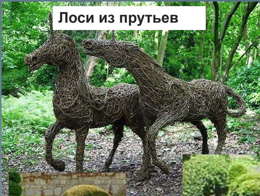
Лоси из прутьев

Участок можно облагородить фигурами из проволоки и плюща, а также из прутьев.