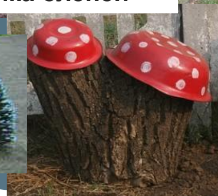
6 Мухоморов (на деревянных пеньках)