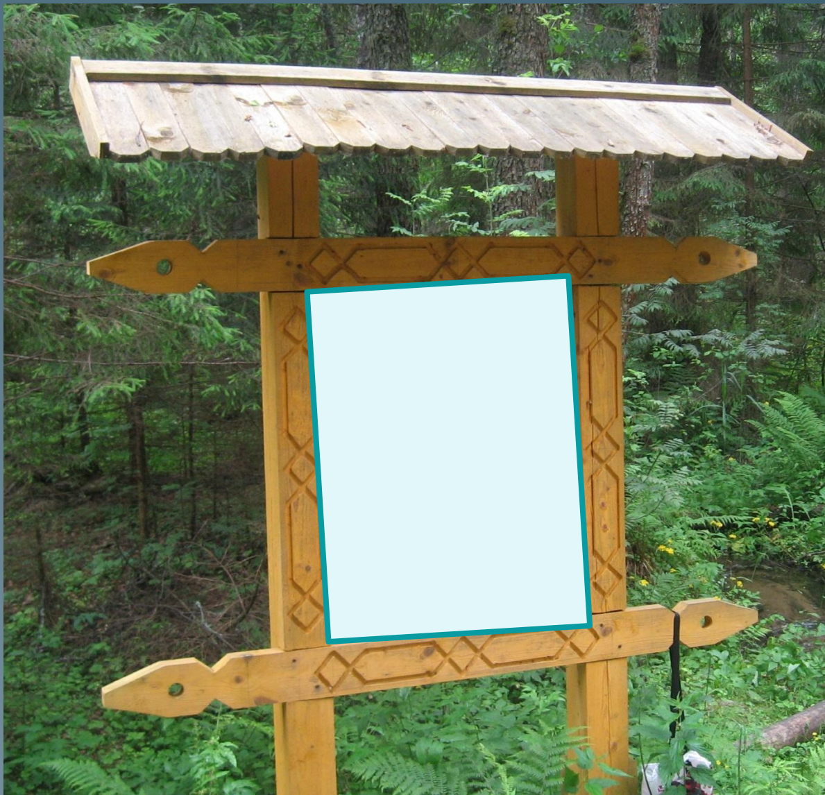
Макет щита для экологической тропы