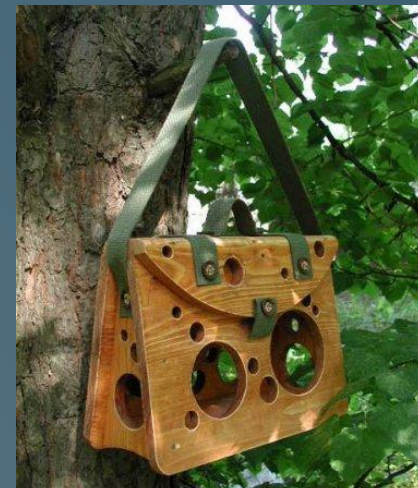
4 кормушки «Школьный портфель» на деревьях