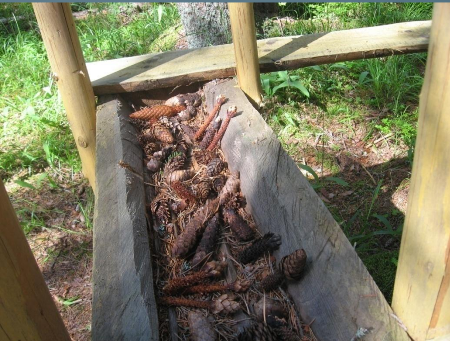
Погрызы белки и дятла