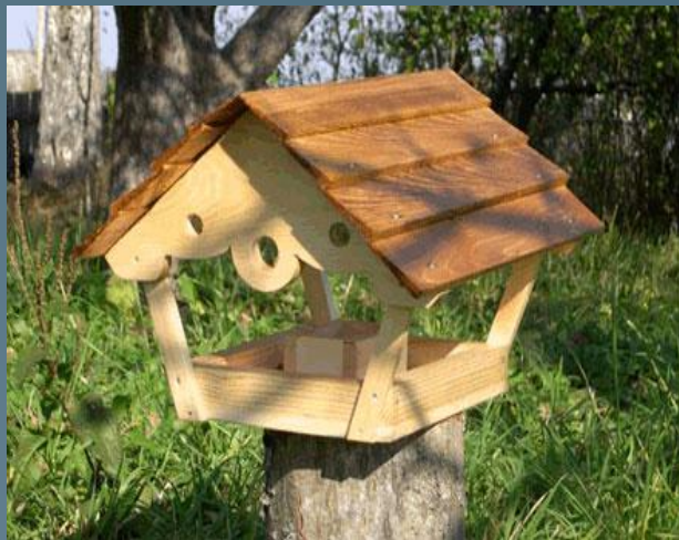
4 кормушки «Гостевой домик» на деревянных столбиках