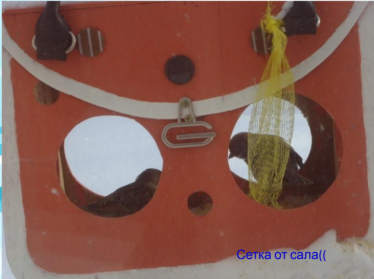
Сетка от сала((