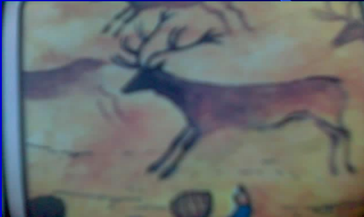
Рисунки древних людей