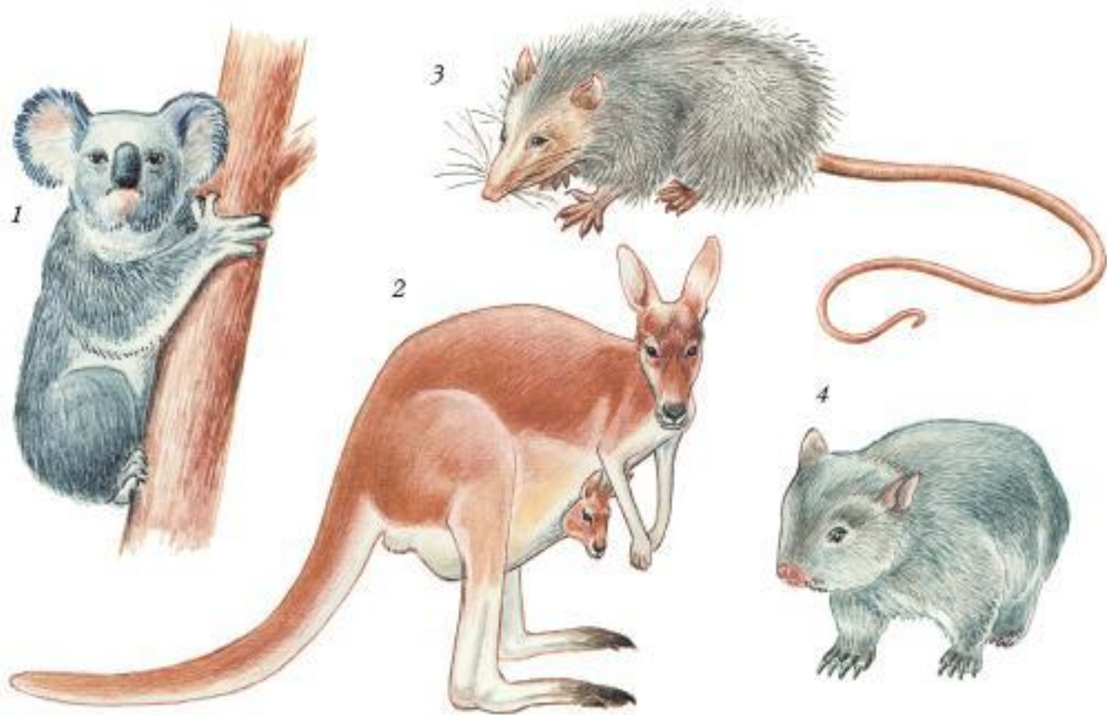
Рис. 207. Сумчатые млекопитающие: 1 — коала; 2 — исполинский кенгуру; 3 — опоссум; 4 — вомбат