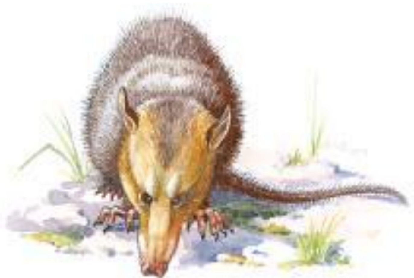
Рис. 206. Примитивное млекопитающее юрского периода