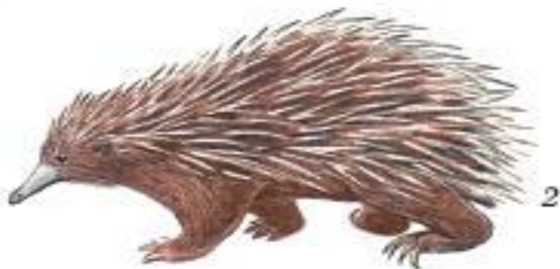
Рис. 205. Утконос (1) и ехидна (2)