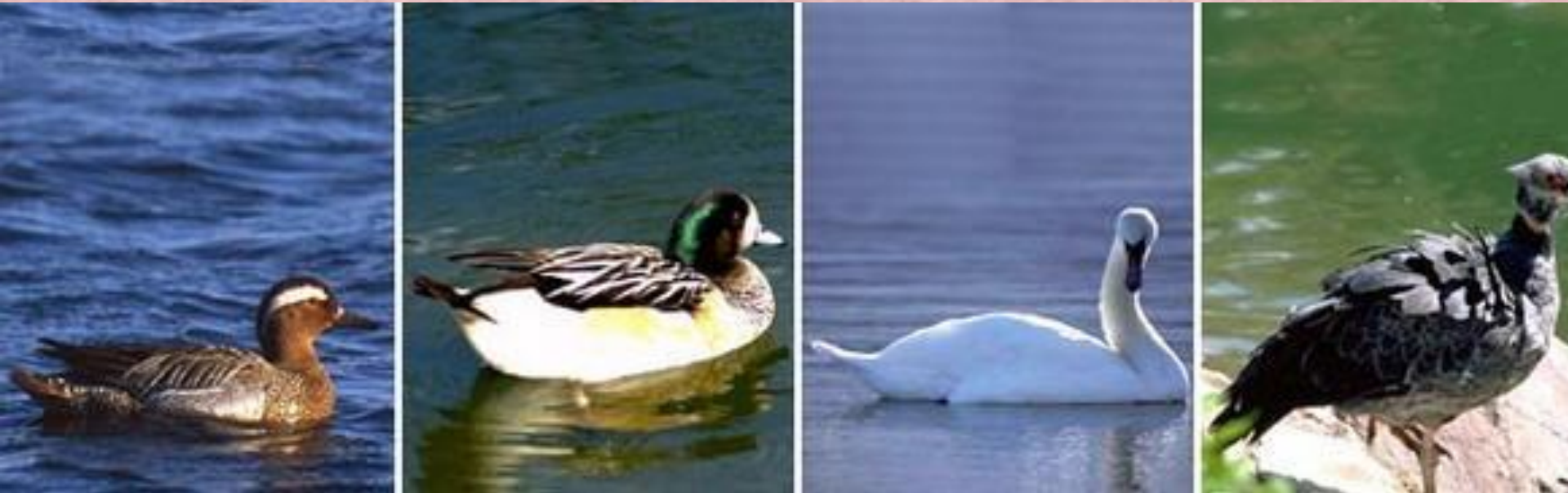
чирок-трескунок, морская чернеть, лебедь-шипун, хохлатая паламедея

. Около 150 видов по всему миру. Гуси и утки разводятся в сельском хозяйстве (употребляется в пищу мясо).