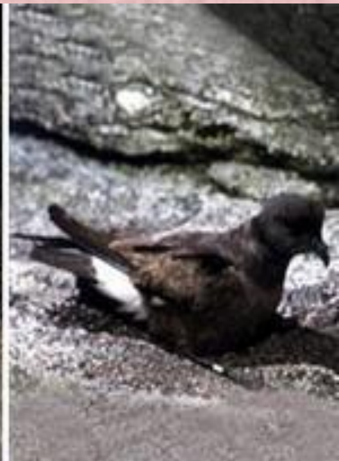
странствующий альбатрос, серый буревестник, глупыш, прямохвостая качурка.