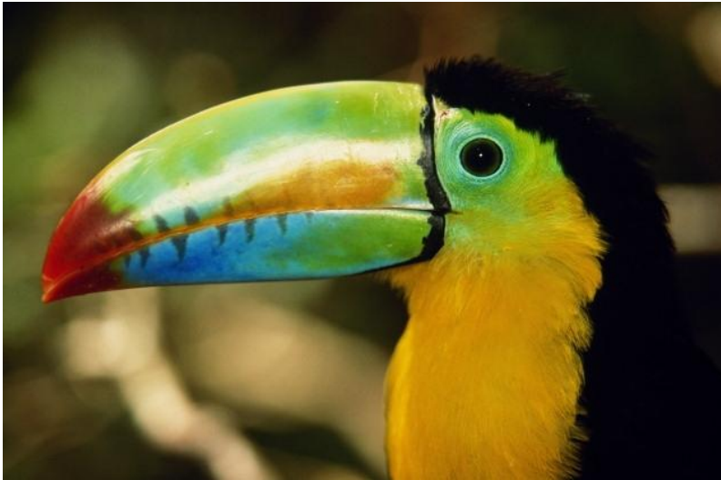
Радужный тукан.