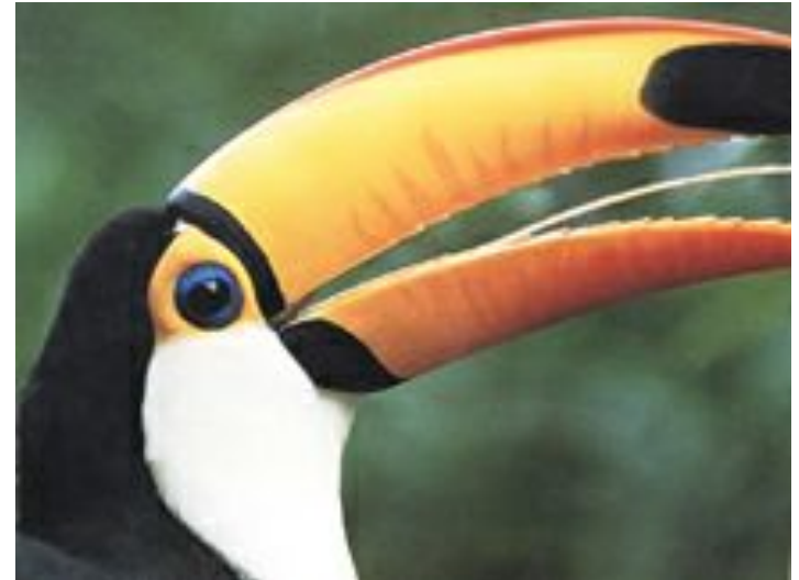
Перцеед токо ( Ramphastos toco ).