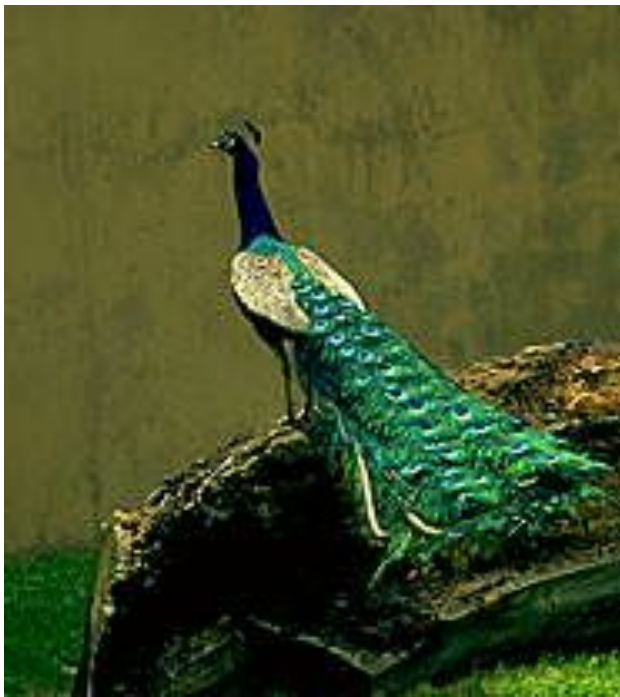
Обыкновенный павлин.