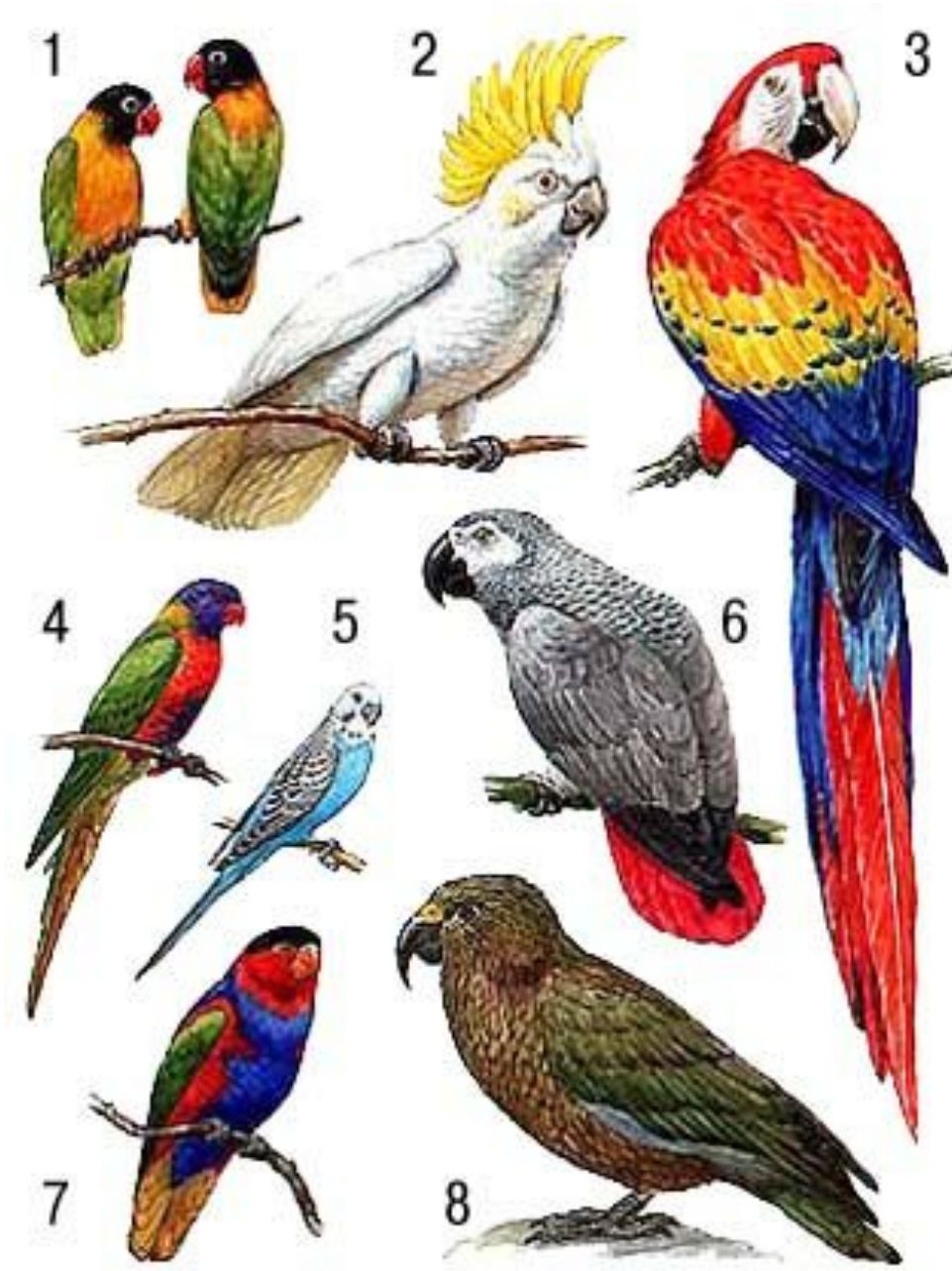
Попугаи: 1 — масковые неразлучники; 2 — желтохохлый какаду; 3 — красный ара; 4 — пестрый лори; 5 — волнистый попугай; 6 — жако; 7 — дамский, или черноголовый, лори; 8 — кеа.