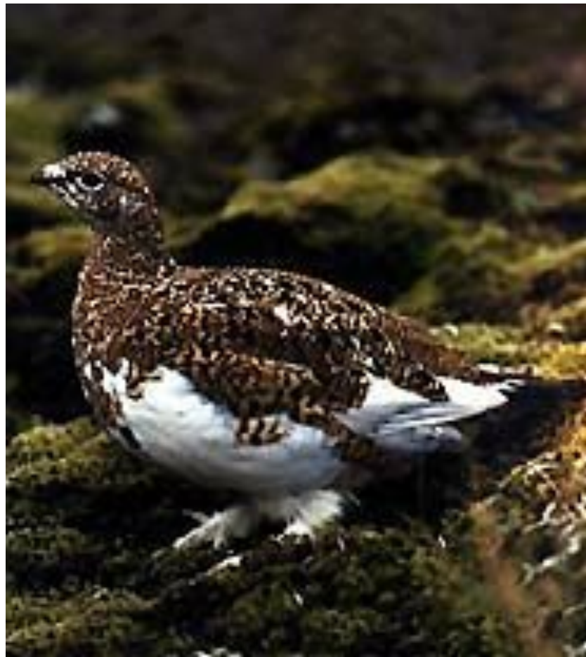
Белая куропатка в период линьки.