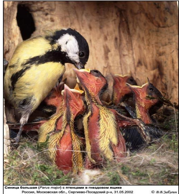
Синица большая ( Parus major) с птенцами в гнездовом ящике Россия, Московская обл., Сергиево-Посадский р-н, 31.05.2002

Гнезда синица делает очень теплые, т.к. гнездится очень рано