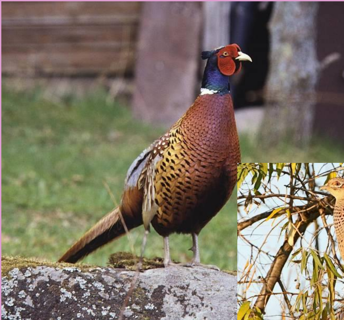
Фазаны: самец и самка