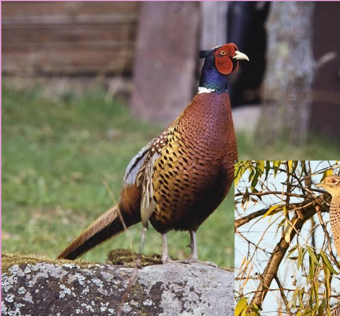
Фазаны: самец и самка