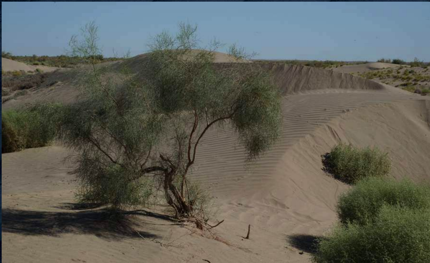
ПОЛУЗАКРЕПЛЕННАЯ ПЕСЧАНАЯ ПУСТЫНЯ