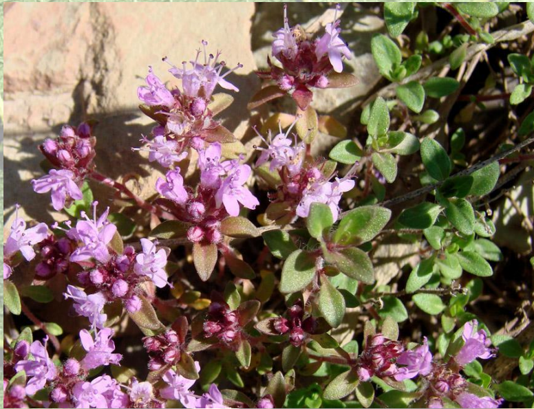
• Тимьян сибирский