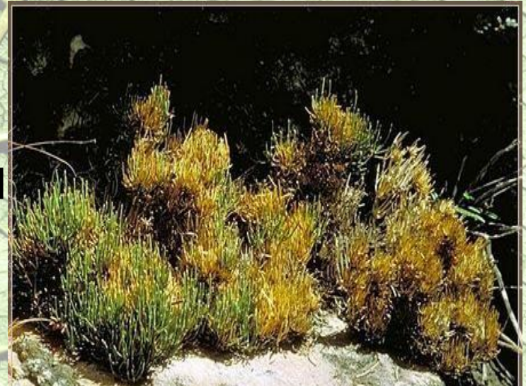
• Хвойник односемянной