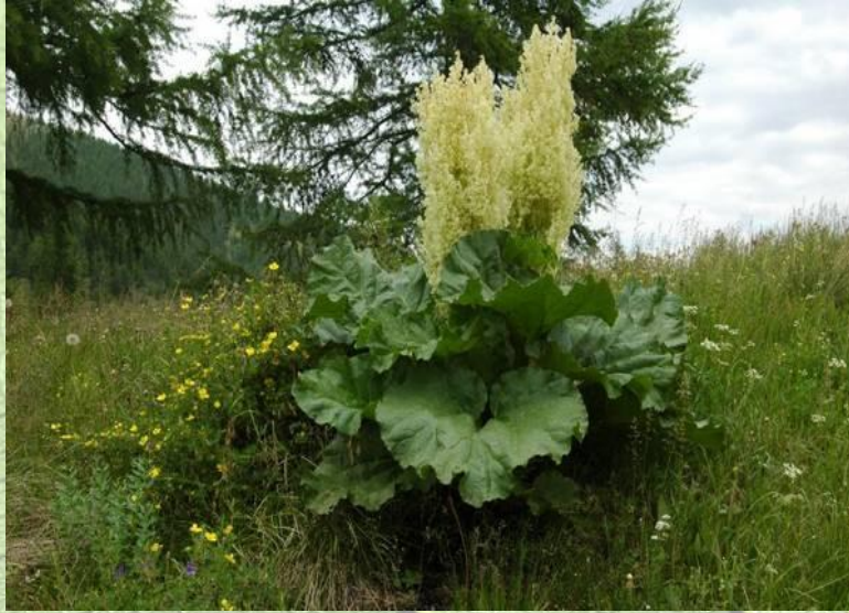
• Ревень компактный