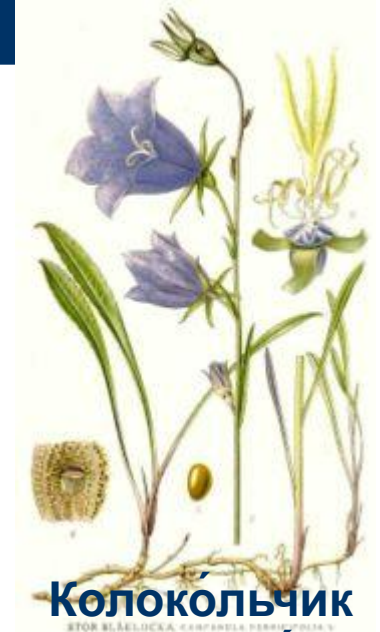
Колокольчик персиколист ный