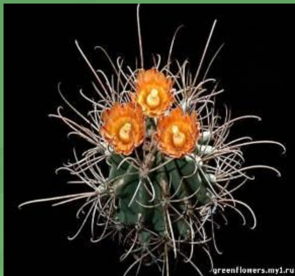
Аустроцилиндропу нция шиловидная