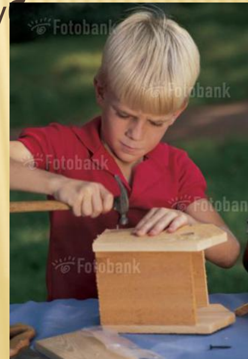
www.FOTOBANK.RU J102-6922 Comstock Images RF Boy building birdhouse