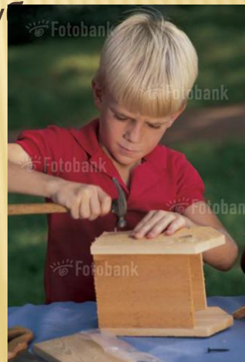
J102-6922 Boy building birdhouse