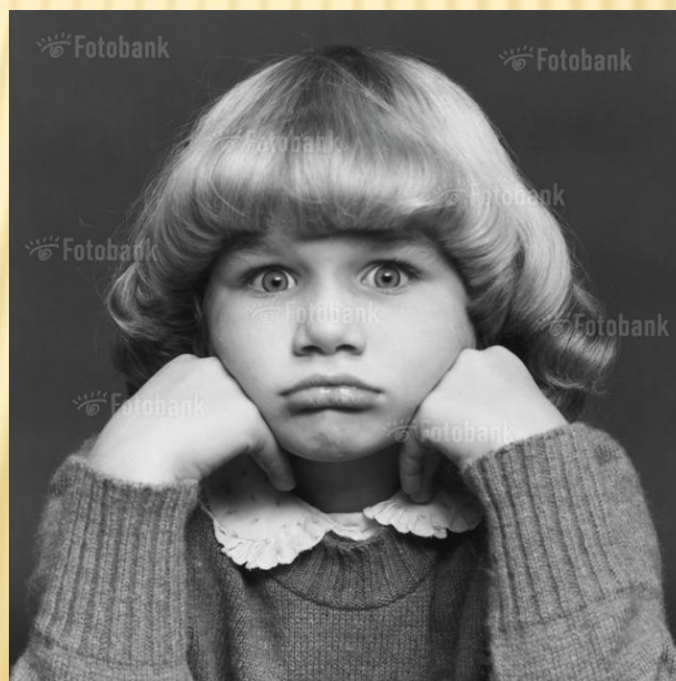
DV05-3949 Portrait of a Sulking girl With Her Hands on Her Chin