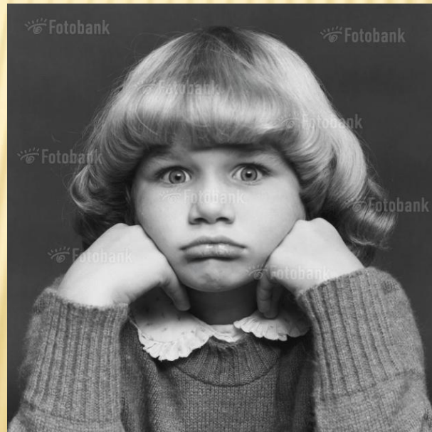
DV05-3949 Portrait of a Sulking girl With Her Hands on Her Chin