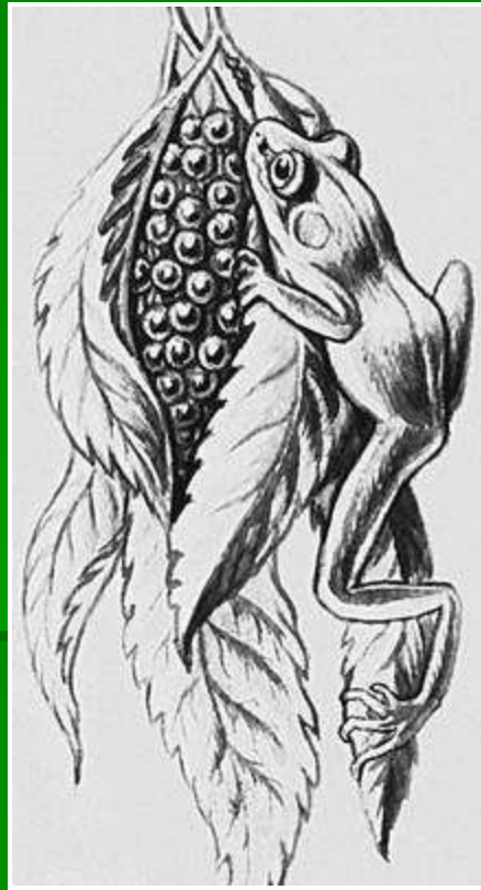
Гнездо южноамериканской филломедузы.