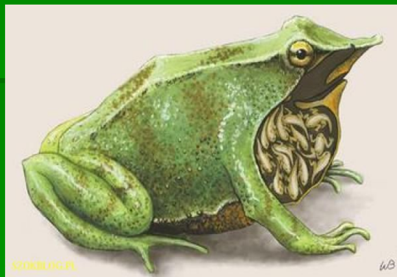
самец лягушки ринодермы