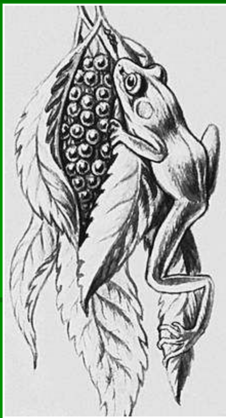
Гнездо южноамериканской филломедузы.