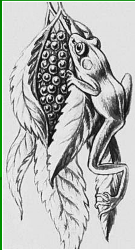
Гнездо южноамериканской филломедузы.