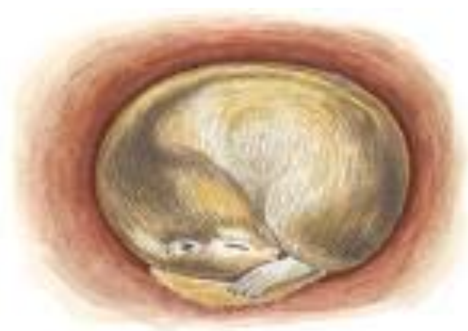
Рис. 204. Спящий в норе суслик