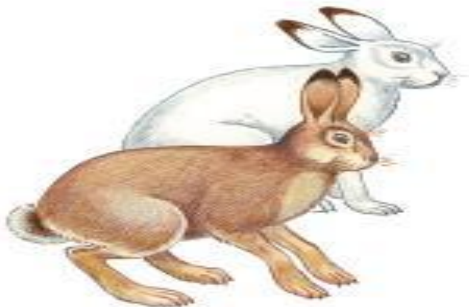
Рис. 203. Заяц-беляк в зимнем и летнем меху