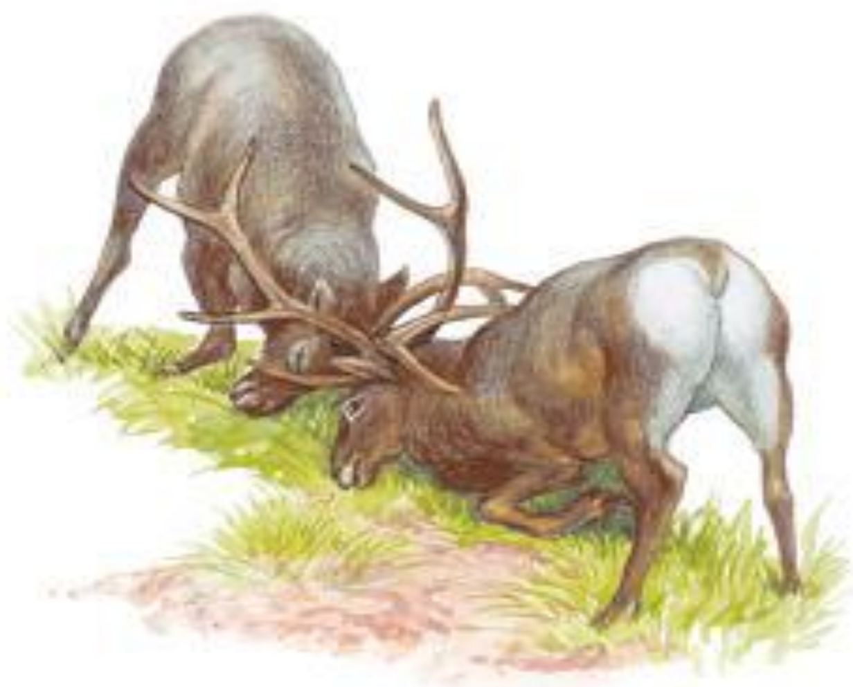
Рис. 201. Турнирный бой самцов оленей