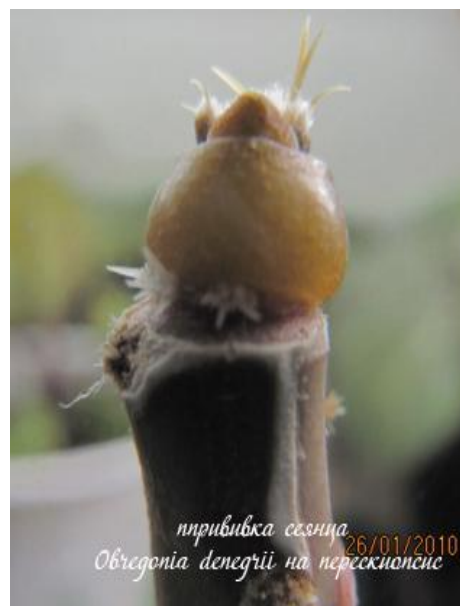
прививка сегмента Обregonia denegrii на перескионисе 26/01/2010