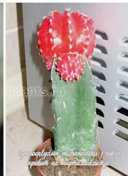
Gymnocactus michanovichii f. rubra привит на ширтилокактусе