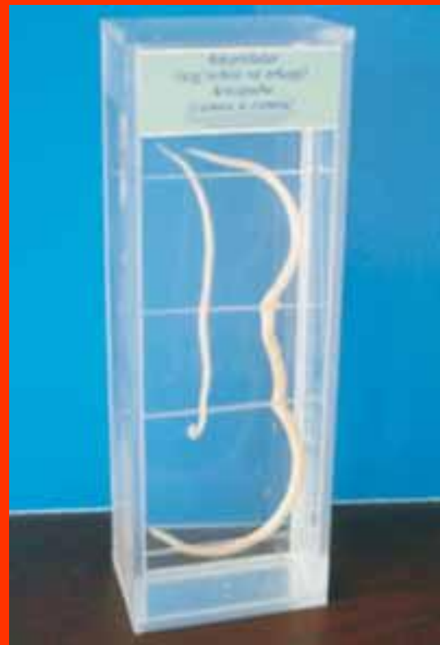
Влажный препарат аскариды

Скорость размножения и плодовитость колоссальны. Например, самка аскариды ( Ascaris lumbricoides ) способна отложить в день до 200 тыс. яиц.