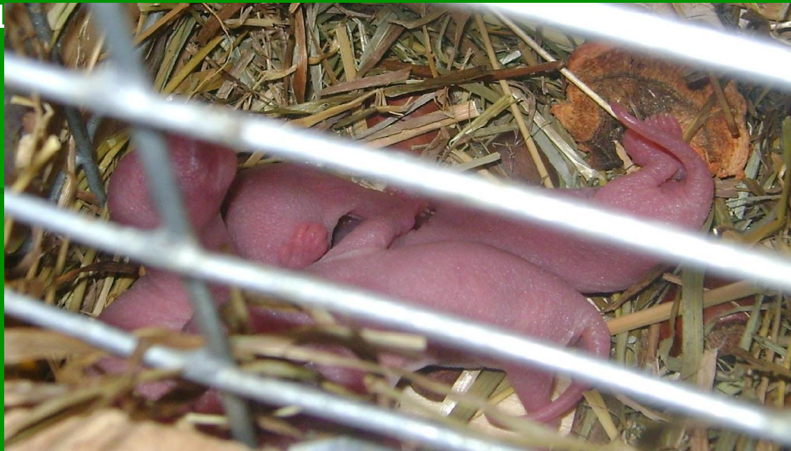
Рис. 3 Новорождённые

Как – то мы заметили, что белка ведёт себя странно. Примерно через месяц у нашей Грызуны появилось 4 бельчонка. Она за ними пристально следила и не давала самцу приближаться к малышам.