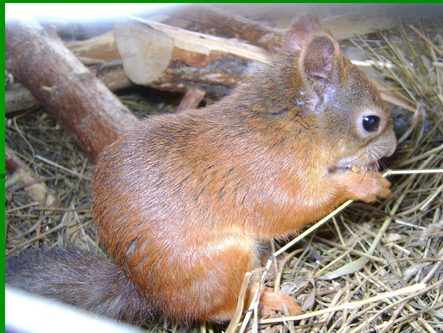
Рис. 9 Взрослый самец

На нашей планете существует множество видов белок. И некоторые виды выселяют наших рыжих белок со своей территории.