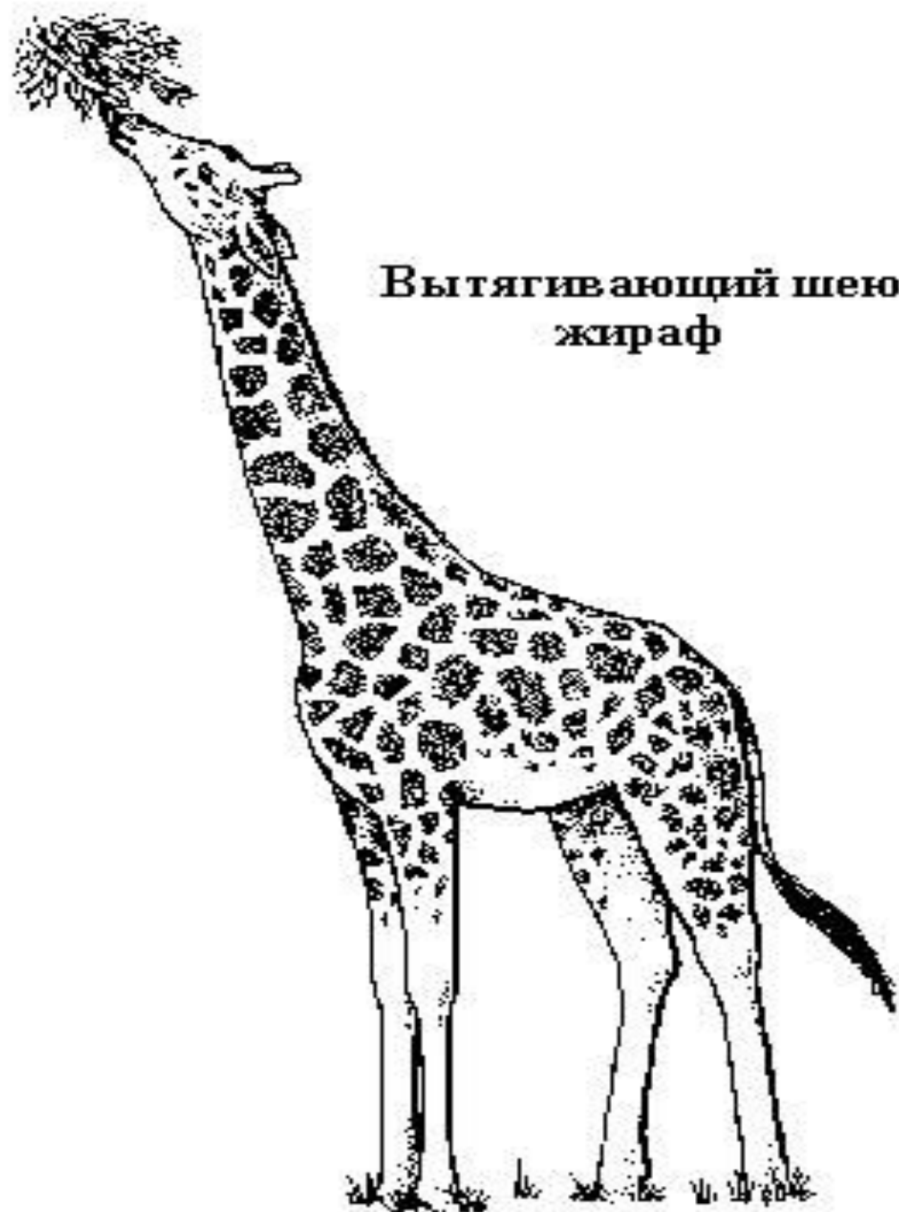
Вытягивающий шею жираф