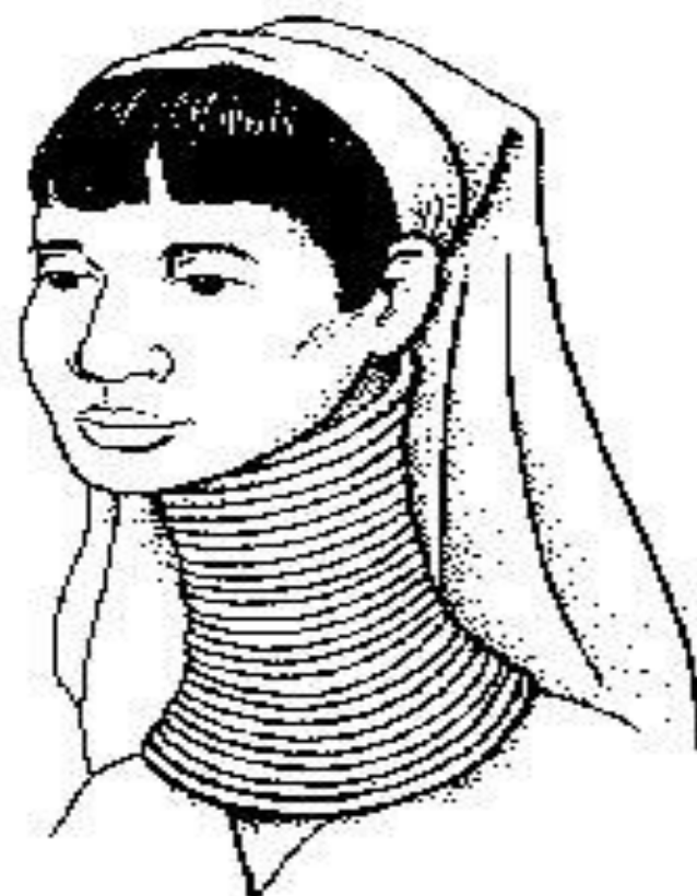
Женщина из племени Па Донг с удлиненной шеей