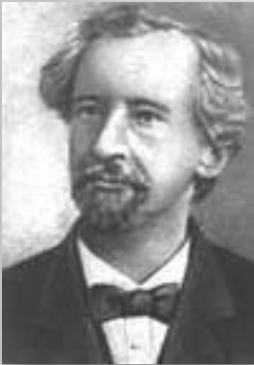
Г. де Фриз

Только через 35 лет открытые Менделеем закономерности были переоткрыты заново независимо друг от друга тремя учёными: