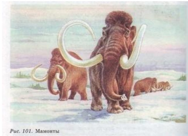
Рис. 101. Мамонты

время расцвета покрытосеменных растений, насекомых и высших позвоночных животных: птиц и млекопитающих