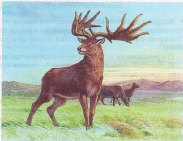
Рис. 103. Большерогий олень

Сумчатые и плацентарные млекопитающие развивались параллельно. От каких-то групп плацентарных насекомоядных произошли хищники и примитивные копытные.