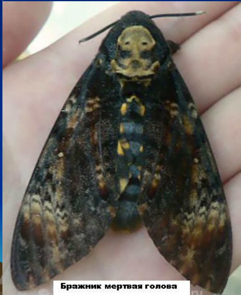
Бражник мертвая голова