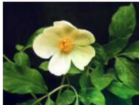
Зимовник или морозник кавказский