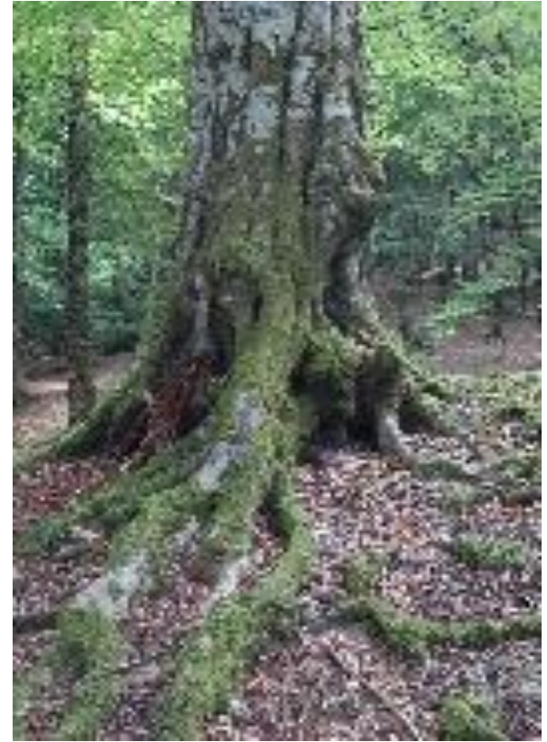
Поверхностные корни граба.