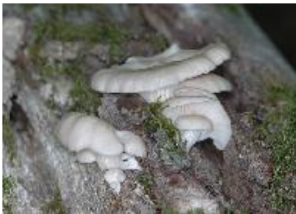
Вешенка в лесу.