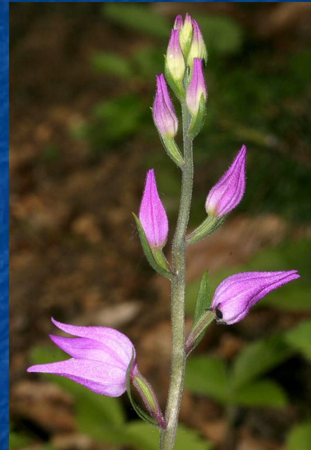
Пыльцеголовник красный- Cephalanth rubra (L.) Rich