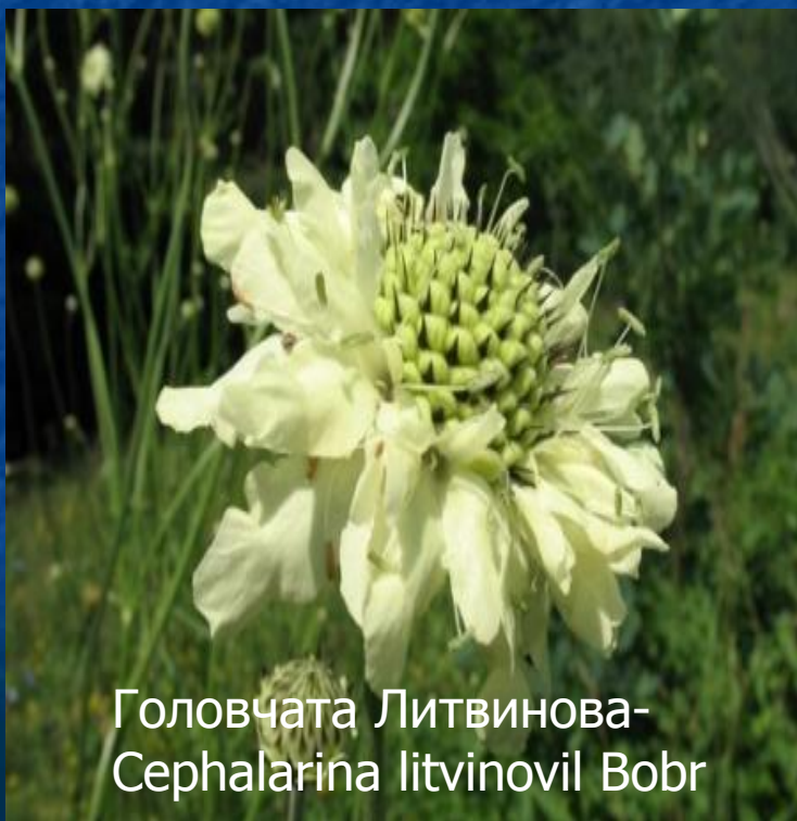
Головчатая Литвинова- Sephalaria litvinovii Bobr