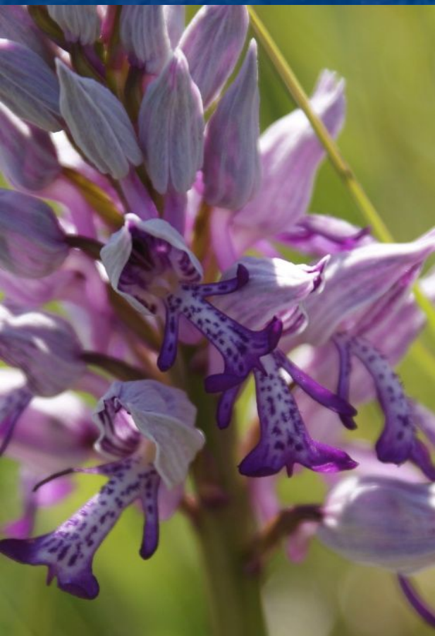
Ятрышник шлемоносный- Orchis militaris L.