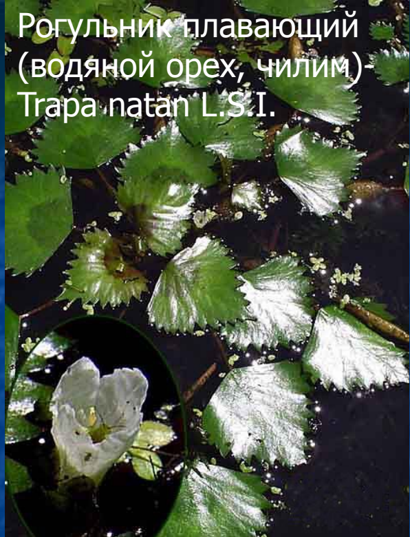
Рогольник плавающий (водяной орех, чилим) Trapa natans L.S.I.