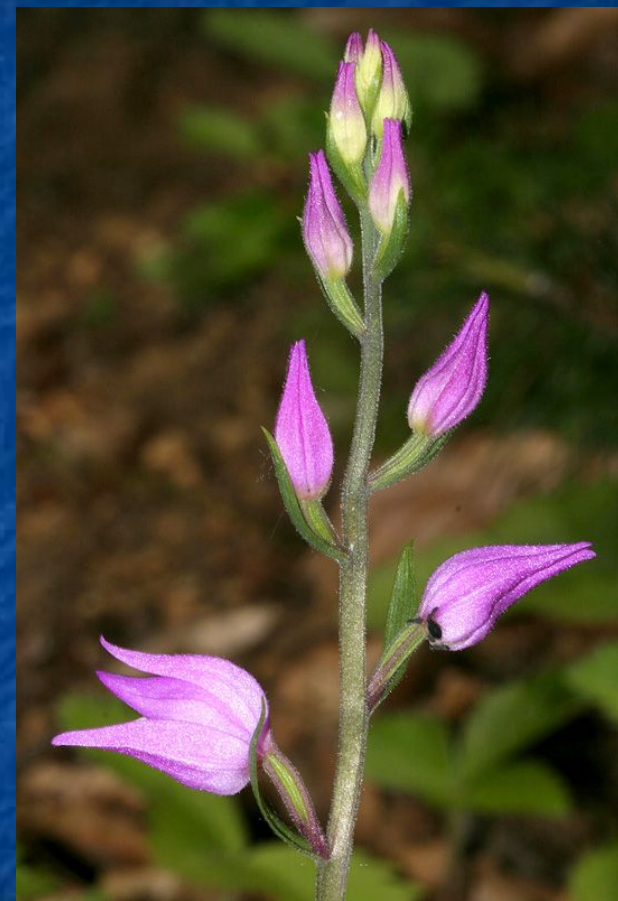
Пыльцеголовник красный- Cephalanth rubra (L.) Rich