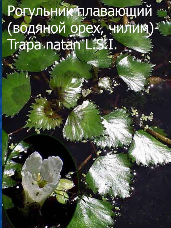
Рогольник плавающий (водяной орех, чилим) Trapa natans L.S.I.