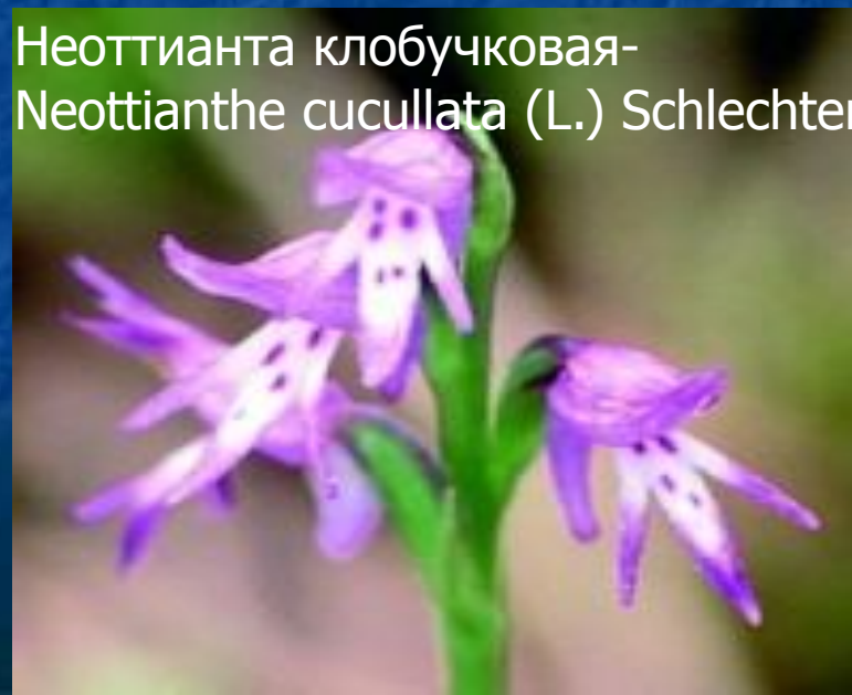
Неоттианта клобучковая- Neottianthe cucullata (L.) Schlechter