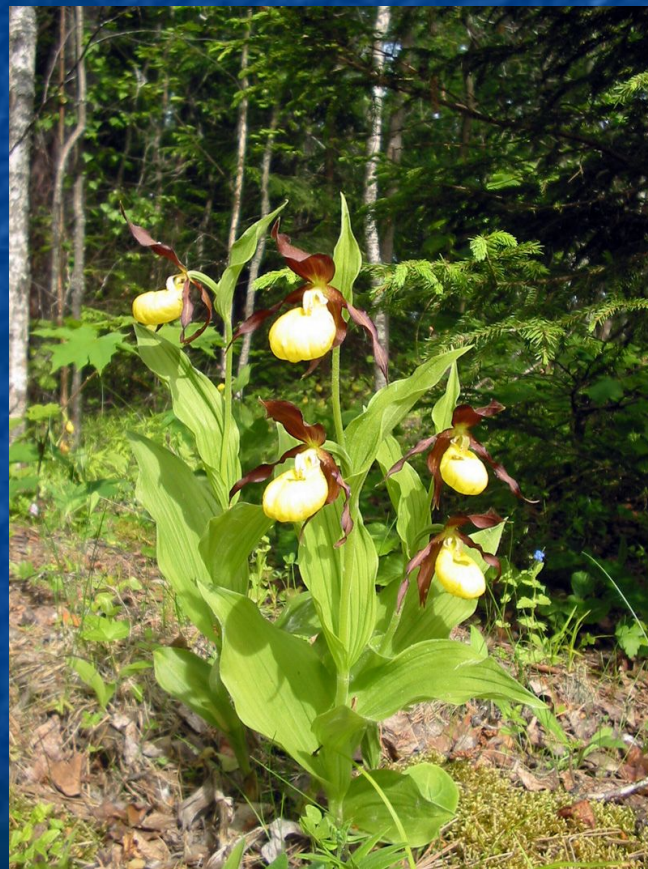
Башмачок настоящий- Cypripedium calceolus L.