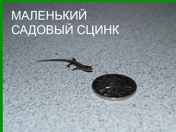
МАЛЕНЬКИЙ САДОВЫЙ СЦИНК