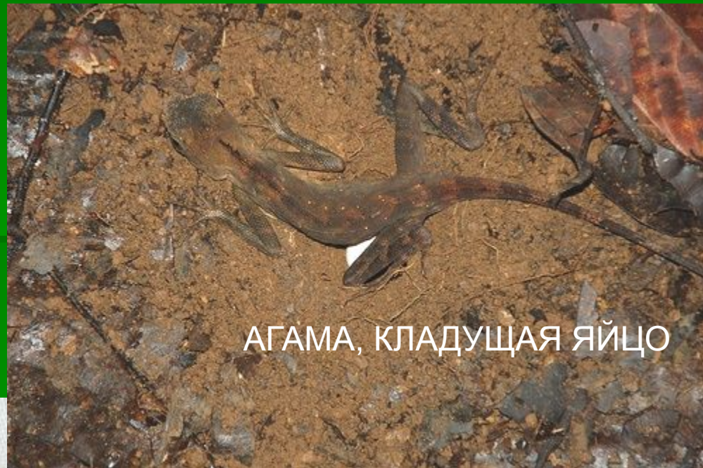
АГАМА, КЛАДУЩАЯ ЯЙЦО