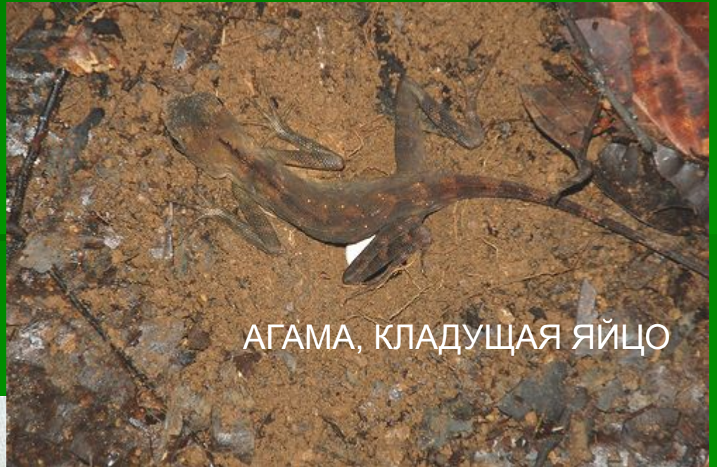
АГАМА, КЛАДУЩАЯ ЯЙЦО