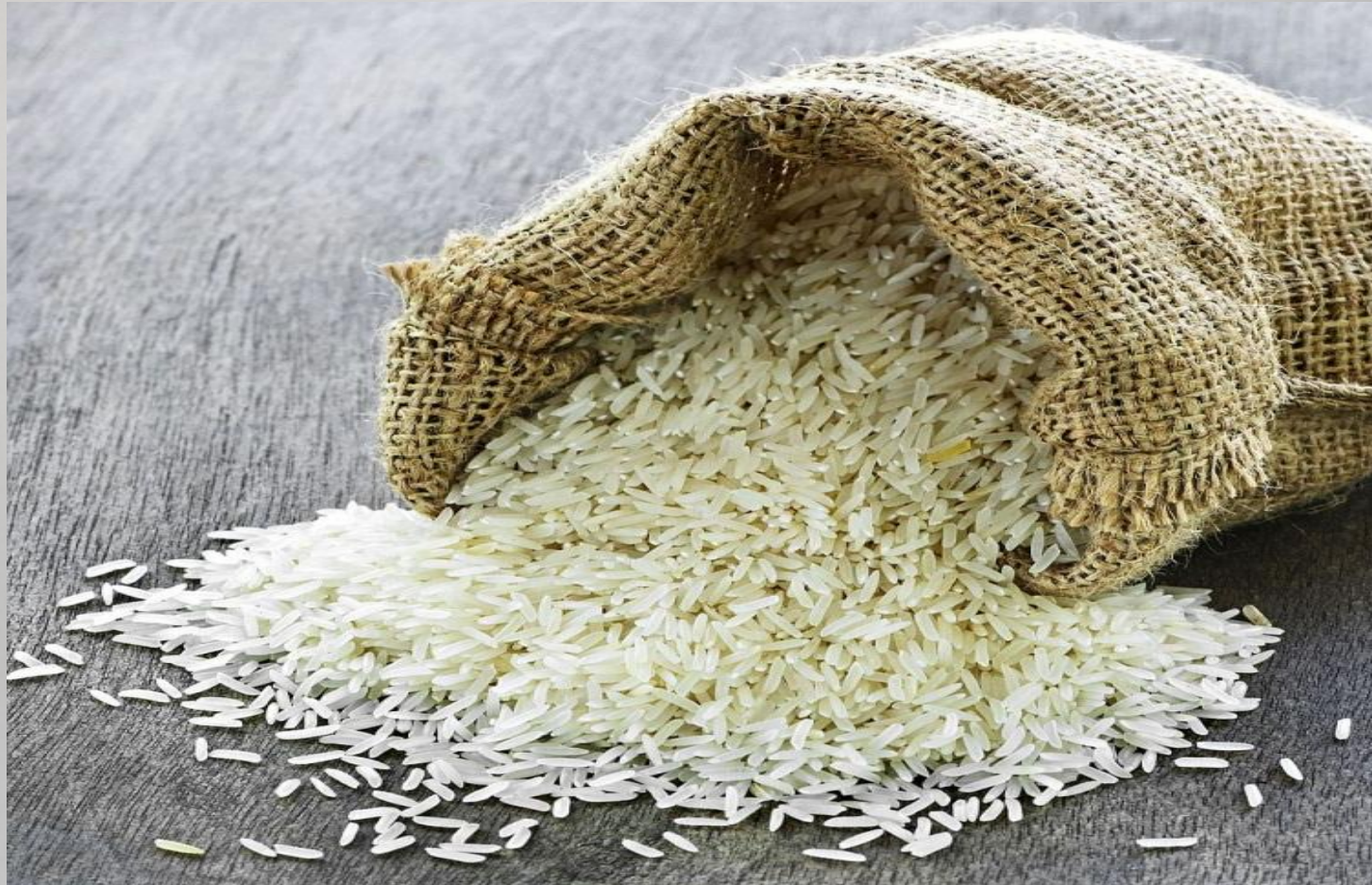
РИС — КУЛЬТУРНА РОСЛИНА.