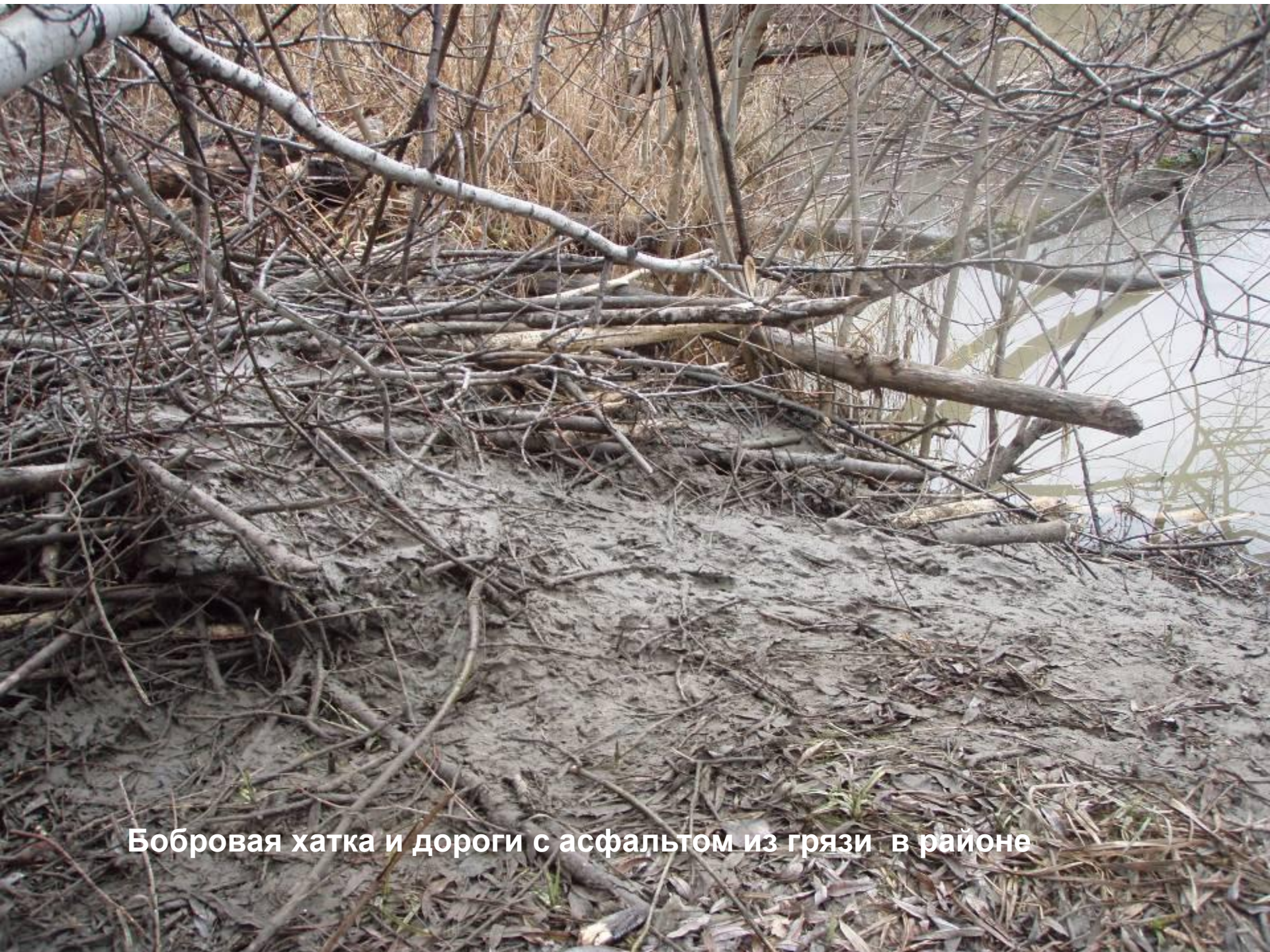
Бобровая хатка и дороги с асфальтом из грязи в районе