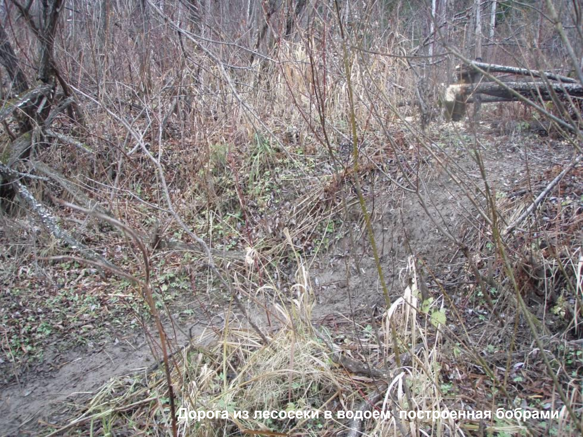
Дорога из лесосеки в водоем, построенная бобрами