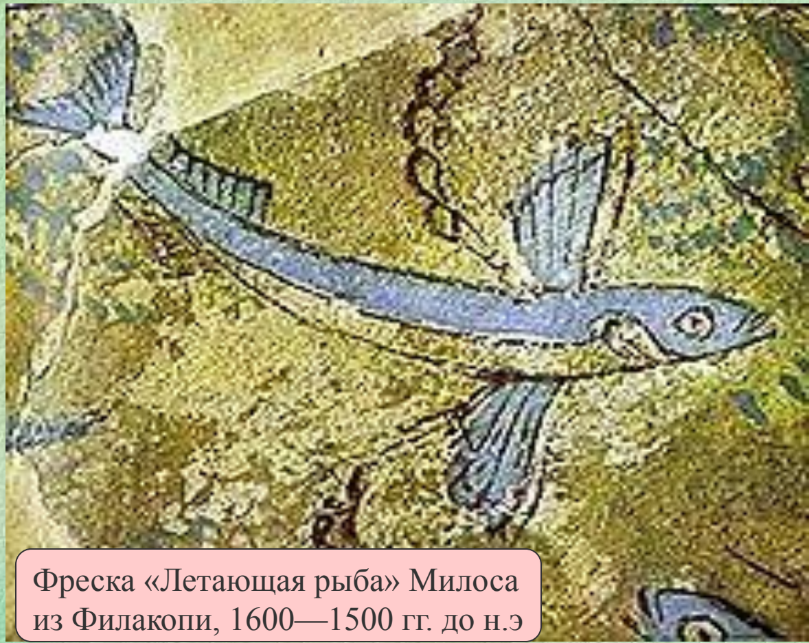
Фреска «Летающая рыба» Милоса из Филакопи, 1600—1500 гг. до н.э

Название семейства летучих рыб Echocoetidae произошло от латинского echocoetus, являющегося транслитерацией древнегреческого слова ἔξωκοῖτος, буквально означающего «спящие снаружи» от корней