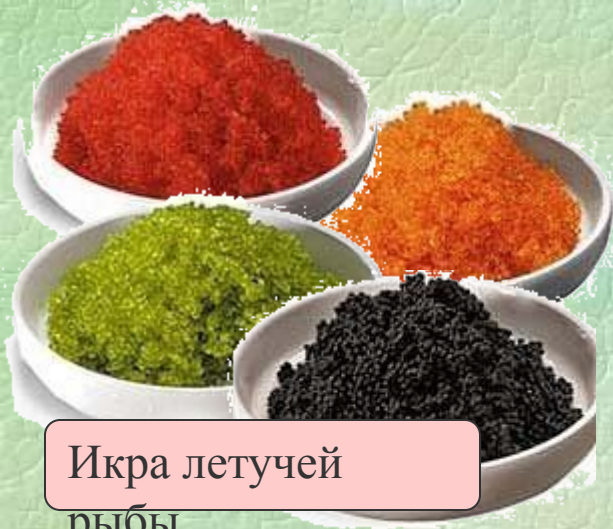
Икра летучей рыбы