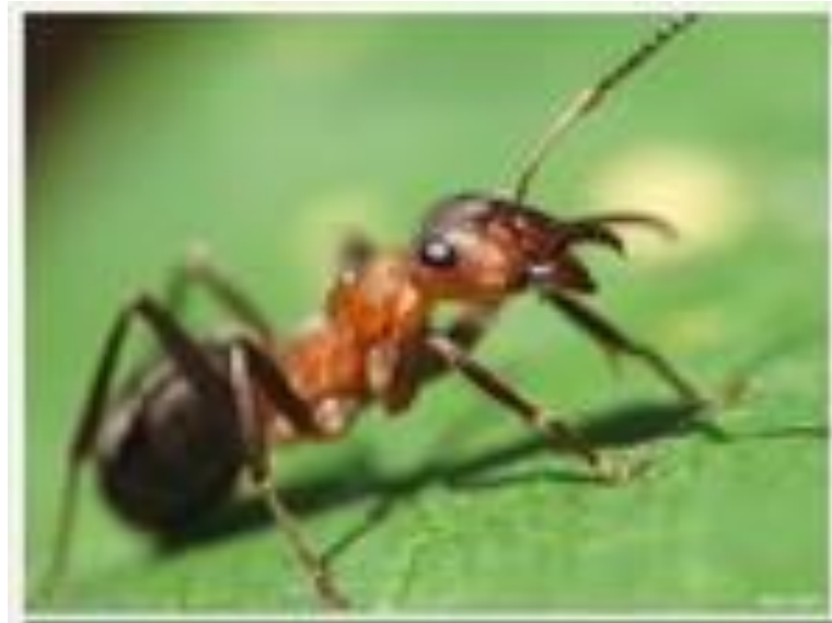
Муравей рыжий лесной ( Formica rufa Linnaeus)

Тело его состоит из подвижно сочлененных между собой отделов – головы, груди, и брюшка. Рассмотрели грудь. Рассмотрев ноги, нашли бедро, голень и лапку. Особи длиной около 7-14 мм, красно-бурого цвета, имеют крупную голову, половину брюшка занимает кислая ядовитая железа, окружённая мощным мускулистым мешком.