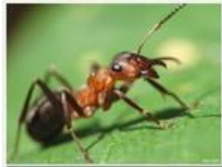
Муравей рыжий лесной ( Formica rufa Linnaeus)

Тело его состоит из подвижно сочлененных между собой отделов – головы, груди, и брюшка. Рассмотрели грудь. Рассмотрев ноги, нашли бедро, голень и лапку. Особи длиной около 7-14 мм, красно-бурого цвета, имеют крупную голову, половину брюшка занимает кислая ядовитая железа, окружённая мощным мускулистым мешком.