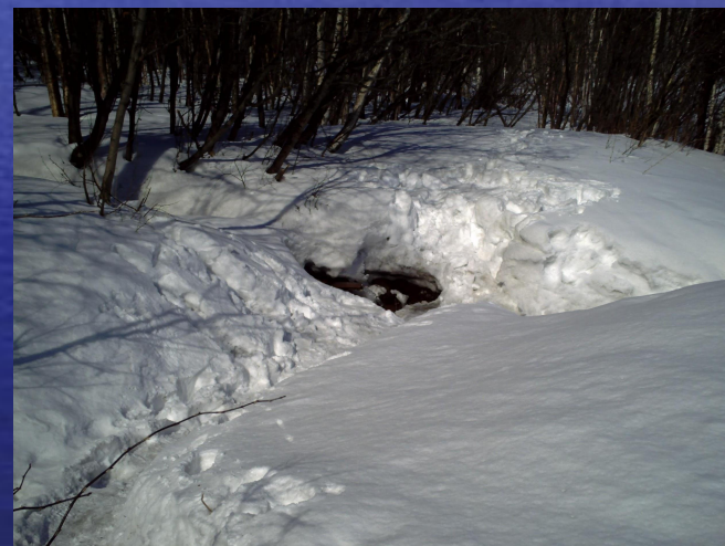
СВЯТОЙ ИСТОЧНИК п. Майский