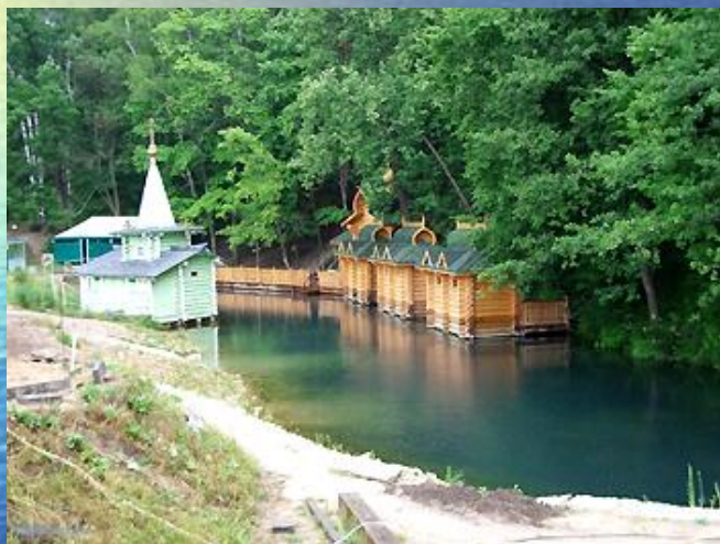
Святой источник преподобного Серафима Саровского

Источник – естественный выход подземных вод на земную поверхность.