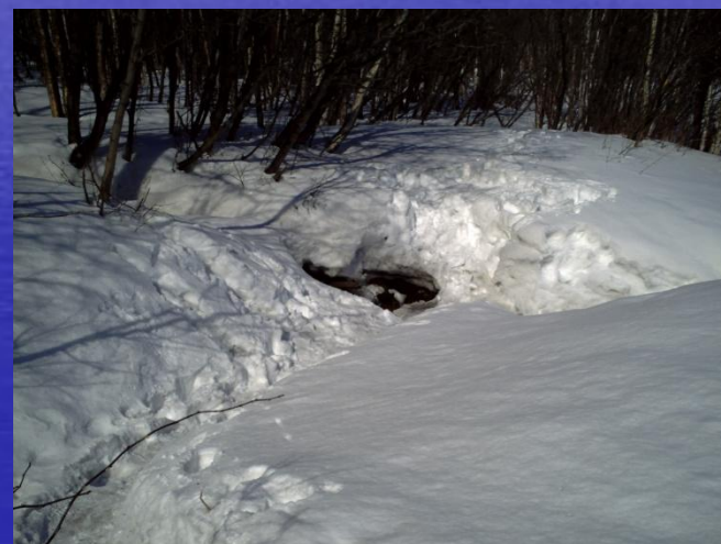
СВЯТОЙ ИСТОЧНИК п.Майский