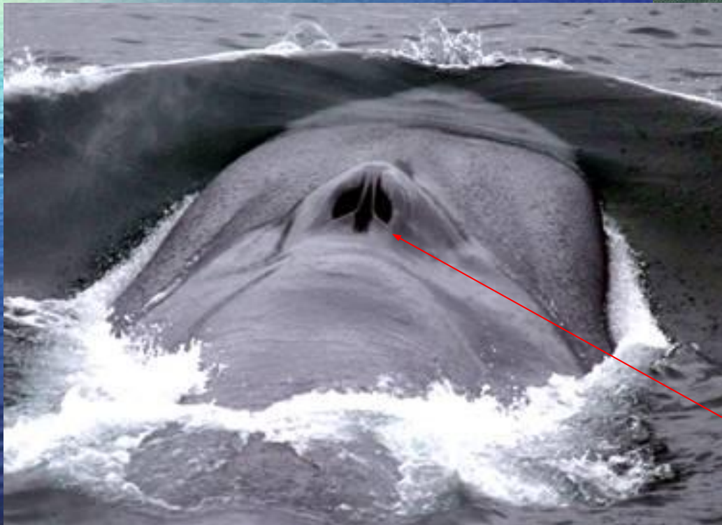
Дыхало синего кита