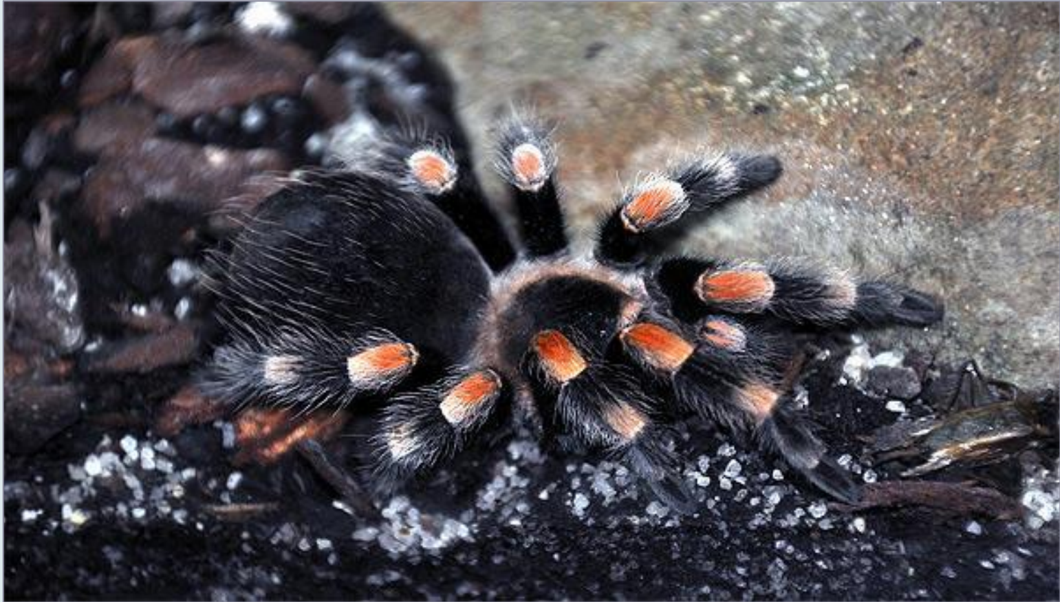
Мексиканский красноколенный птицеед ( Brachypelma smithi )