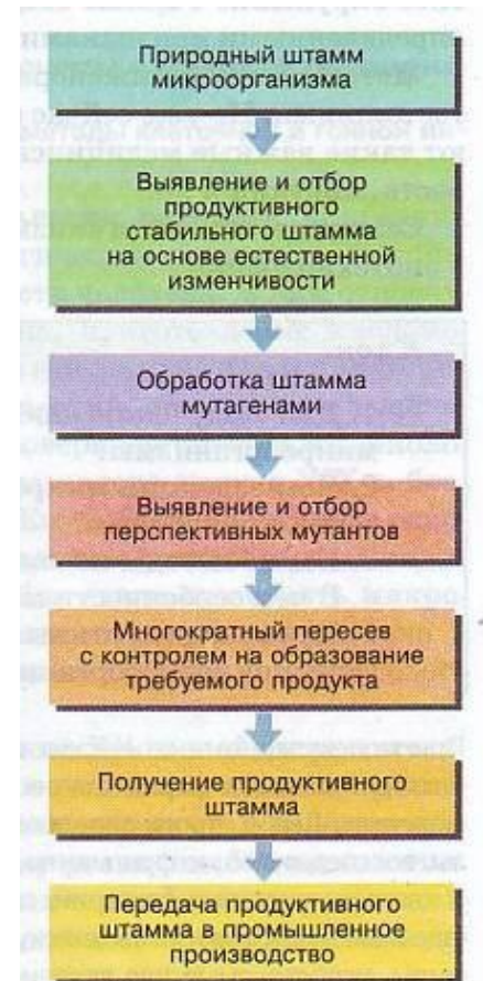
Схема селекции микроорганизмов