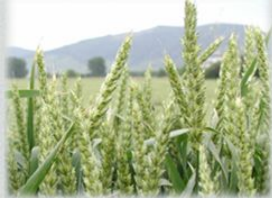
пшеница – самоопыляющееся растение