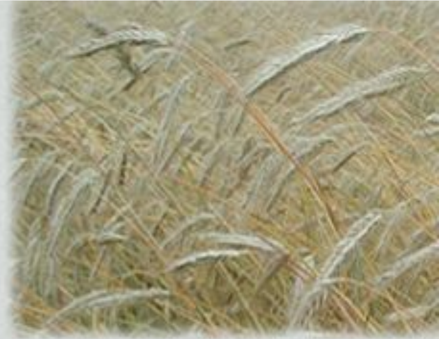
рожь – перекрестно опыляющееся растение