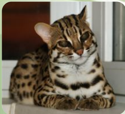
Азиатской леопардовой кошки