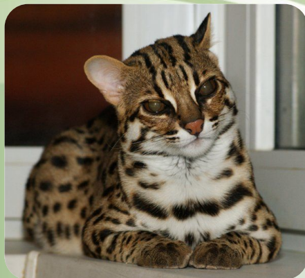
Азиатской леопардовой кошки