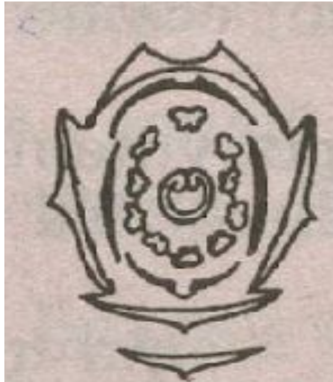
Диаграмма цветка растений семейства