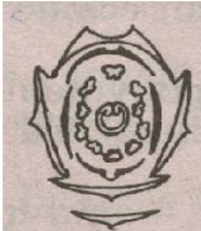
Диаграмма цветка растений семейства