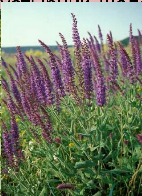
Шалфей ( Salvia ), род растений семейства губоцветных.