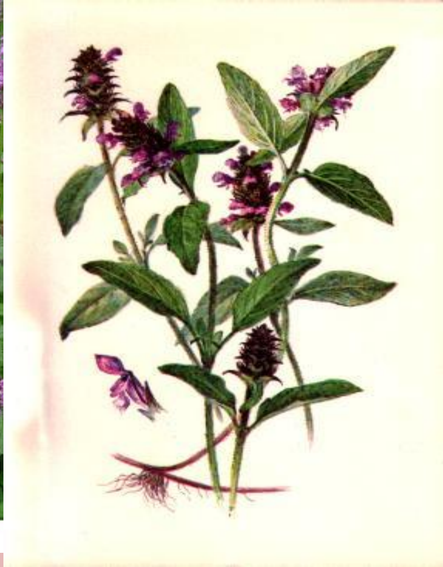
Lamiaceae - BETONICA OFFICINALIS - bukvice lékařská

Буквица лекарственная и черноголовка обыкновенная