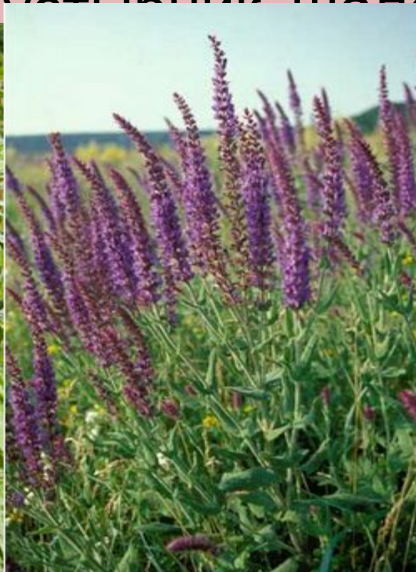
Шалфей ( Salvia ), род растений семейства губоцветных.