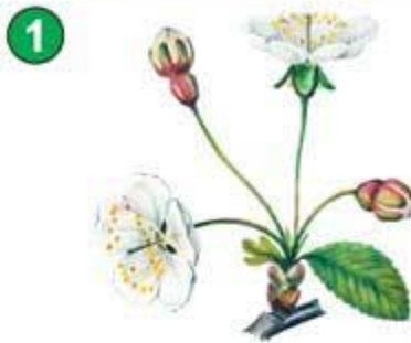
Соцветие вишни – зонтик