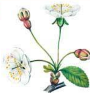
Соцветие вишни – зонтик