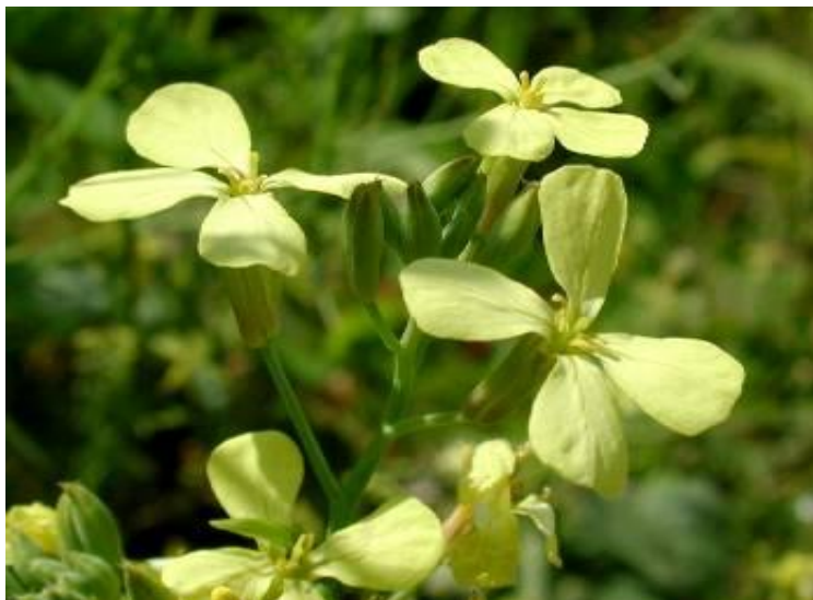
Редька полевая ( Raphanus raphanistrum )