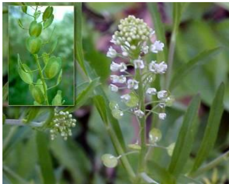
Ярутка полевая ( Thlaspi arvense )