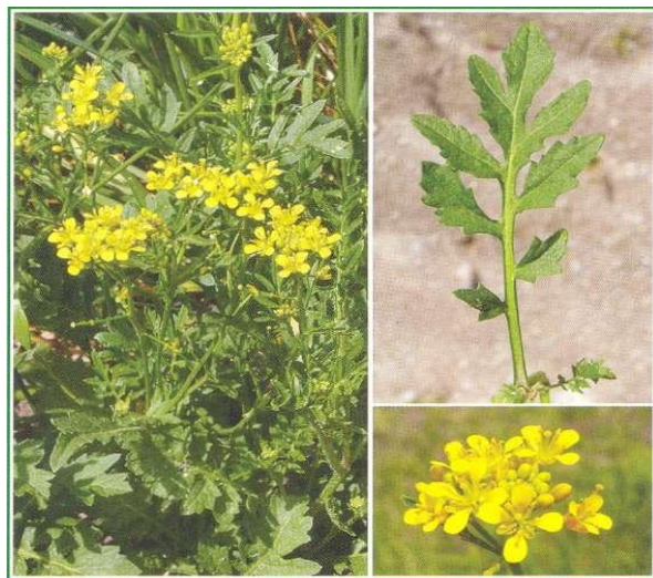
Жерушник лесной ( Rorippa sylvestris ).