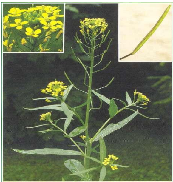
Желтушник лакфиолевидный ( Erysimum cheiranthoides ).