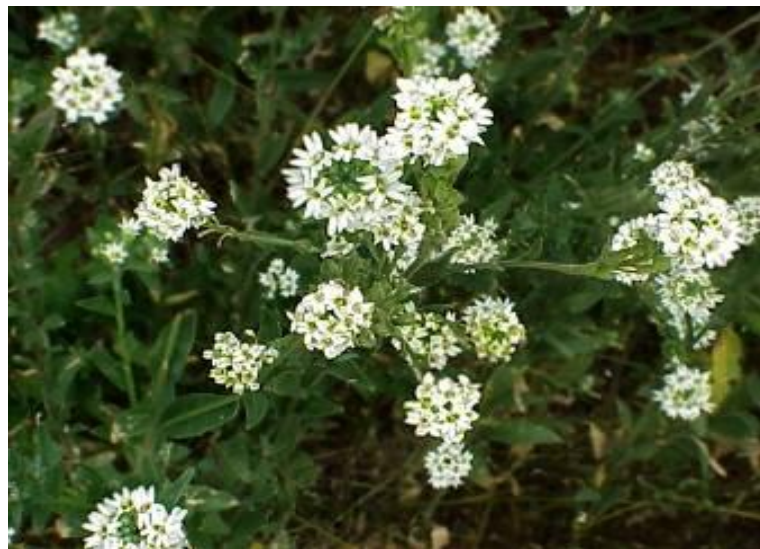
Икотник серый ( Berteroa incana )