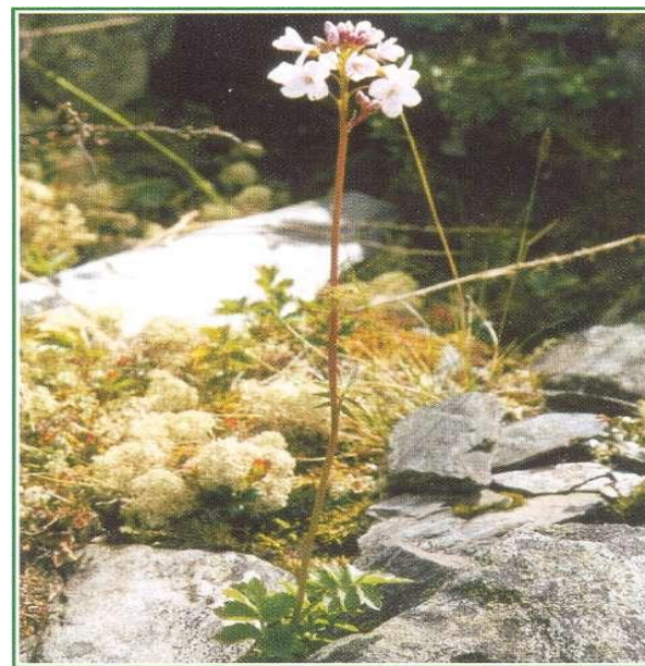
Сердечник крупнолист ( Cardamine macrophylla ).