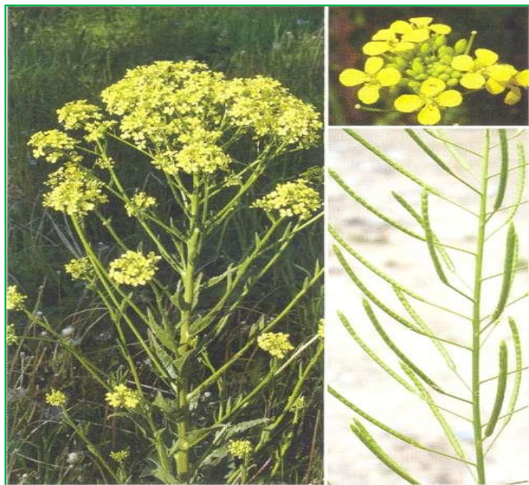
Гулявник Лёзеля ( Sisymbrium loesilii ).