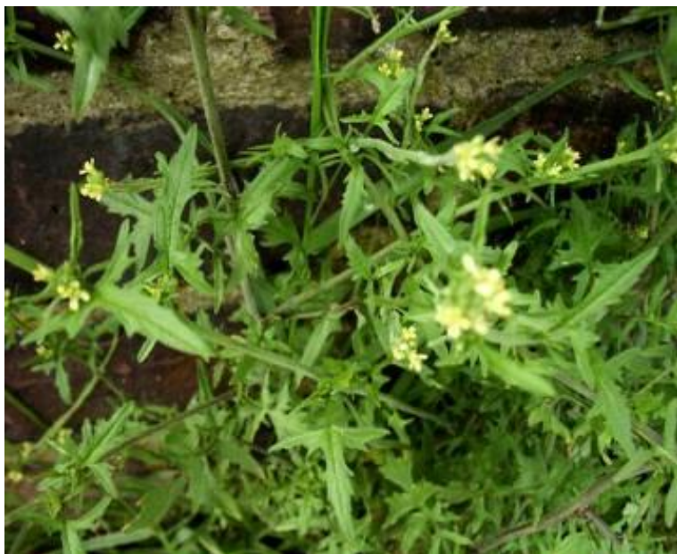
Гулявник Лёзеля ( Sisymbrium loeselii )