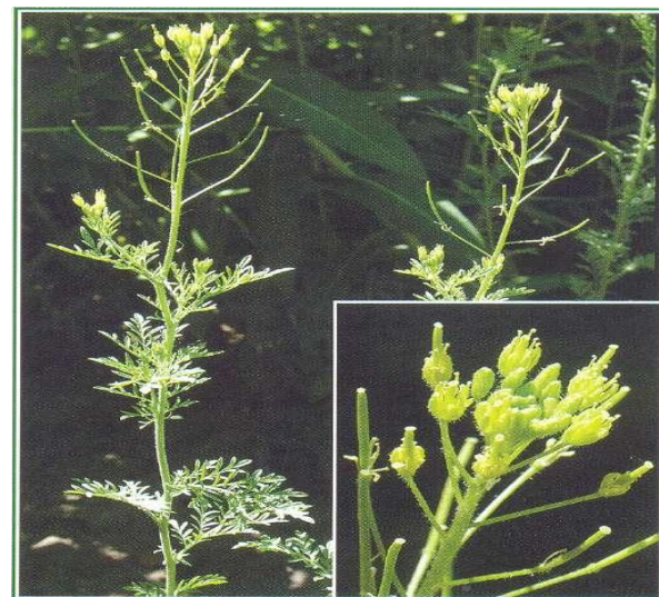
Дескурения Софи ( Descurainia sophia ).