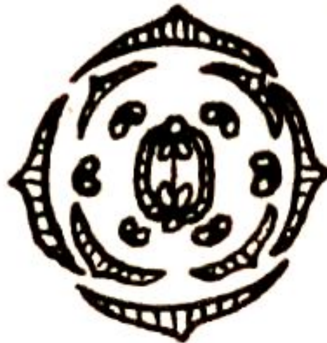
Диаграмма цветка Крестоцветных