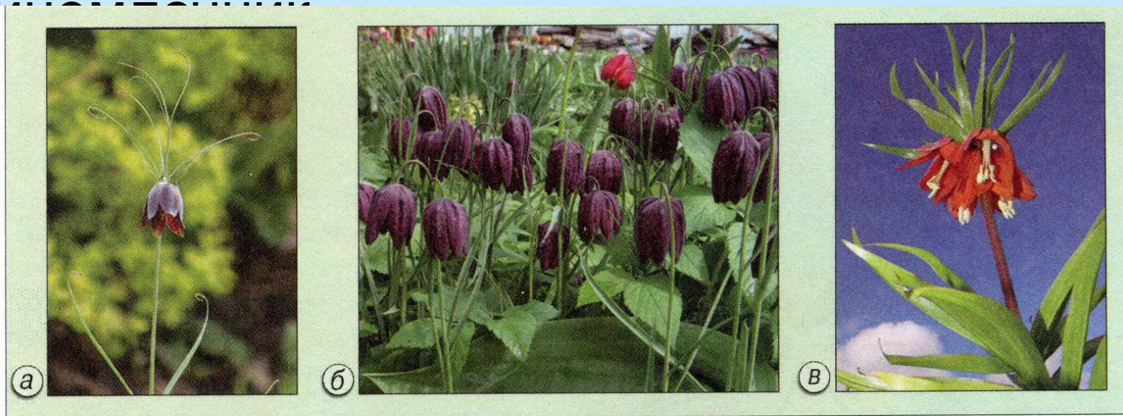
Рис. 20.3. Рябчики: русский (а); шахматный (б); императорский (в)